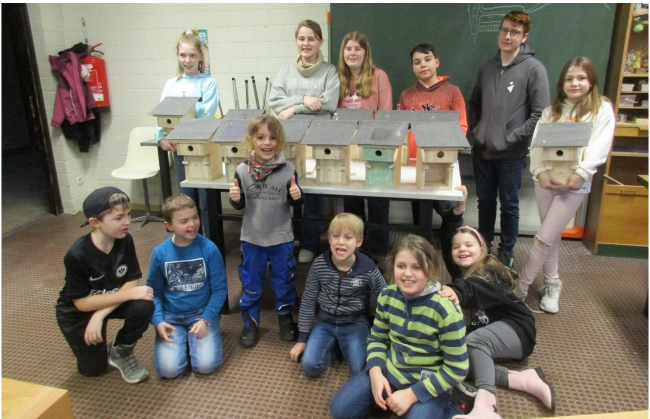
Unsere stolzen Nistkastenbauer!

Hier noch ein paar Bilder von unseren Aktionen: