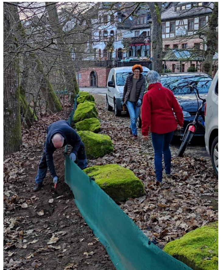
Aufbau des Rückwanderzaunes am 19. März in der Schlossallee!