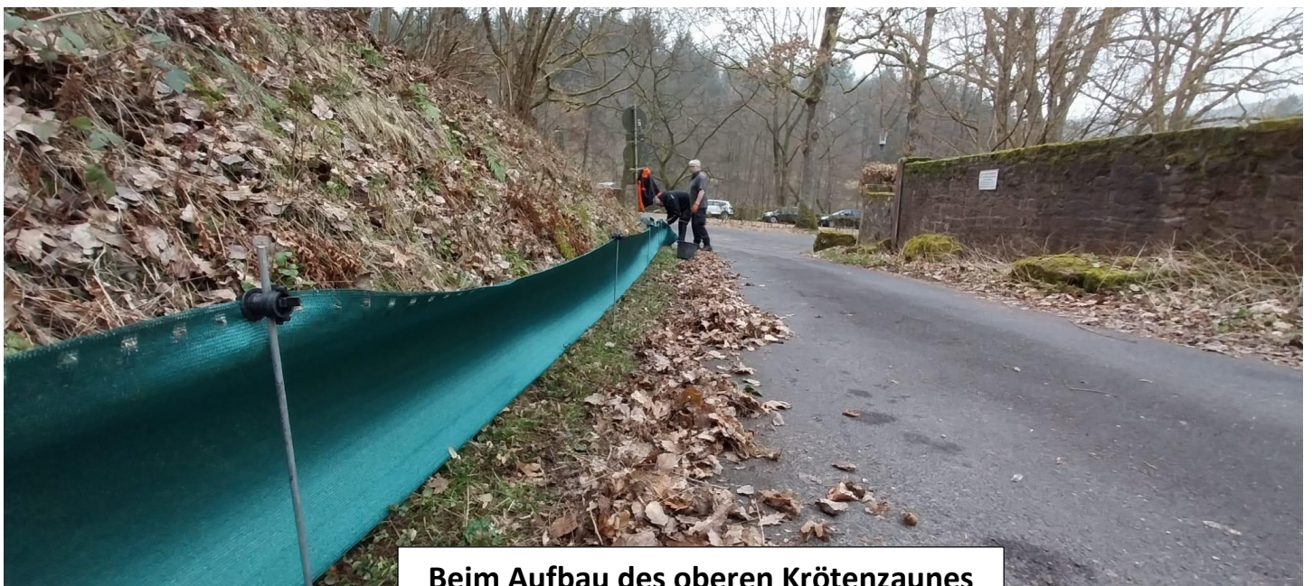
Beim Aufbau des oberen Krötenzaunes am 5. März in der Schlossallee!