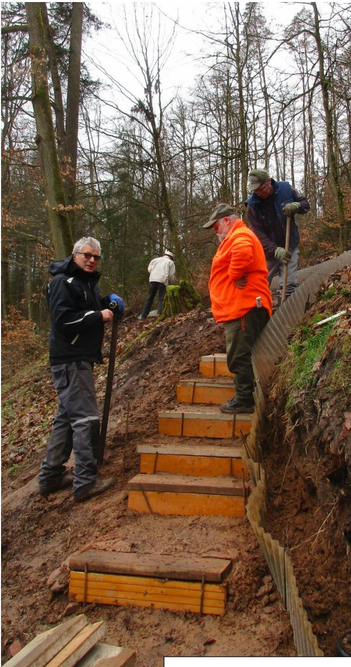
Spezialisten beim Treppen- und Geländerbau!