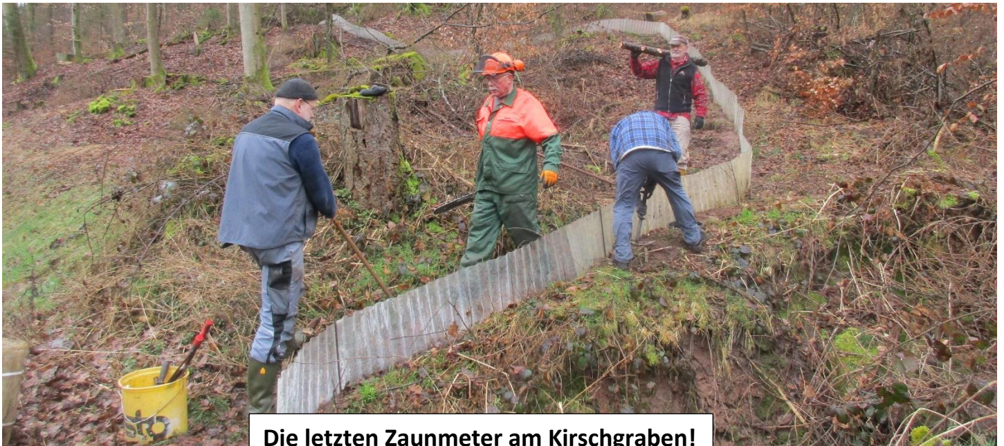
Die letzten Zaunmeter am Kirschgraben!