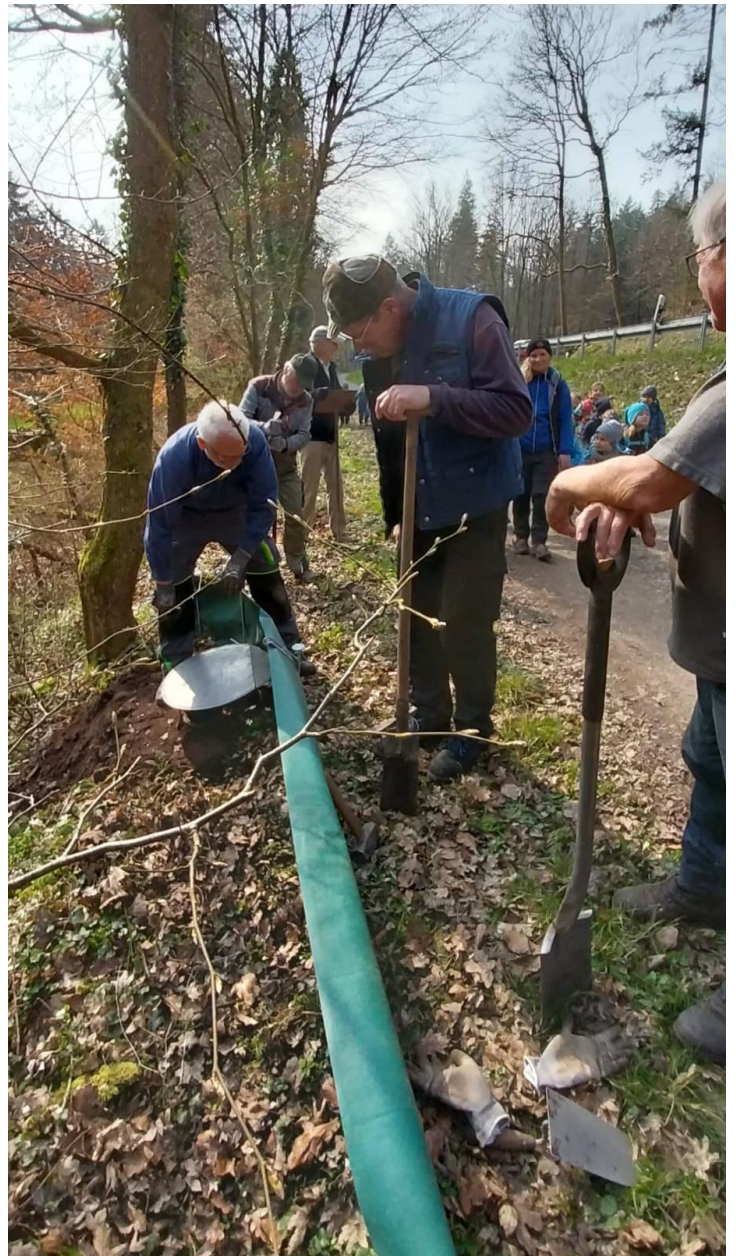
Am 21. März Aufbau des Rückwandaunes am Höllhammer und Besuch vom Kindergarten Dammbach!