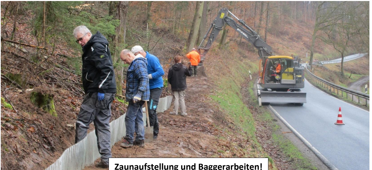
Zaunaufstellung und Baggerarbeiten!